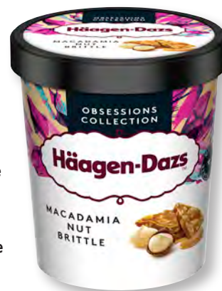
Pint Macadamia Nut Brittle 460 ml - Pack 8 02 20 42