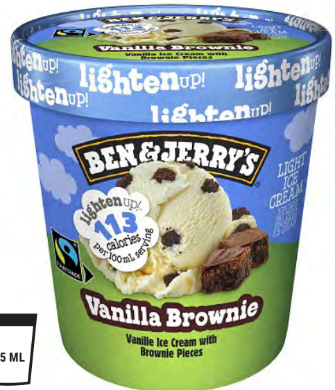
Pint lighten up - Vanilla brownie 465 ml - Pack 8 10 14 32