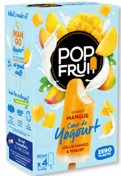
Coeur de Yogourt Mangue / Mango 4x60 g - Pack 12 07 20 15