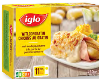
Chicons au gratin Witloofgratin 450 g - Pack 6 24 15 06