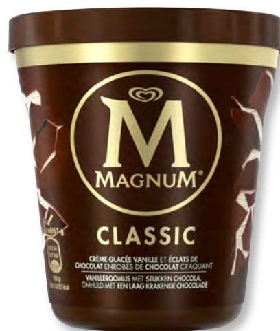
Pint Classic 440 ml - Pack 8 10 01 98