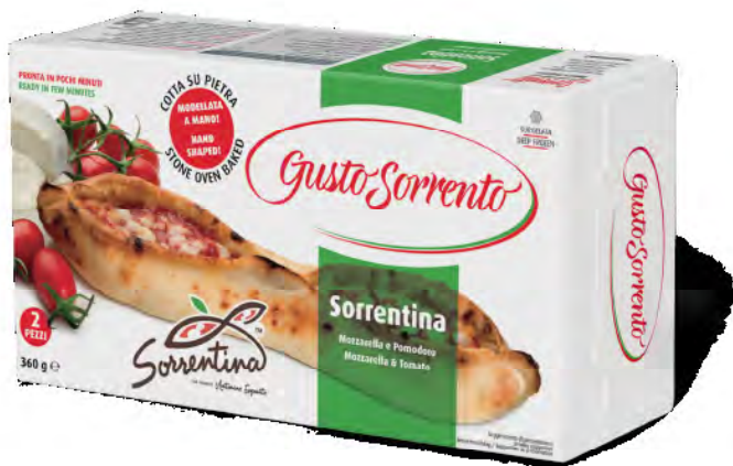
Pizza sorrentina - Mozzarella & tomato 2x180 g - Pack 10 22 10 53