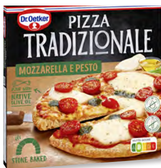
Mozzarella e Pesto 385 g - Pack 5 22 08 42