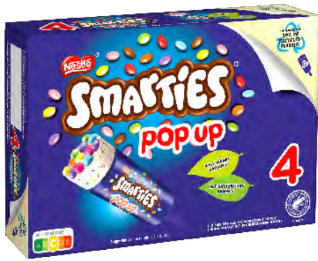
Smarties Pop Up 4x85 ml - Pack 6 08 05 19