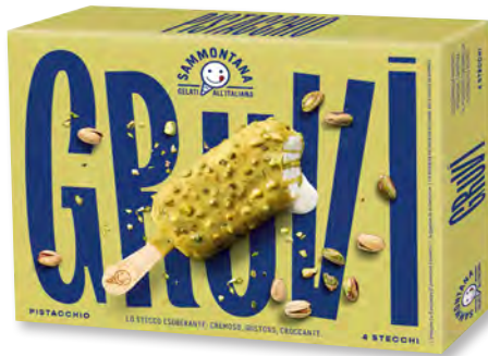
Gruvi Pistache 4x75 ml - Pack 8 27 03 00