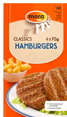
Hamburgers 4 pc/st 280 g - Pack 10 22 20 24