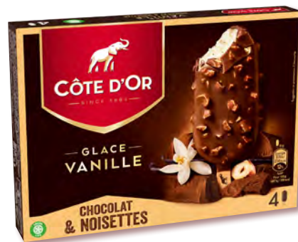
Stick Vanille - Chocolat & Noisette Stick Vanille - Chocolade & Hazelnoot 4X90 ml - Pack 8 18 00 07