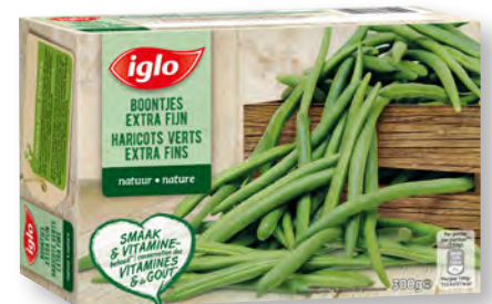
Haricots verts extra fins Boontjes extra fijn 300 g - Pack 6 24 00 06