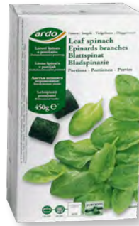
Epinards branches en portions Bladspinazie in porties 450 g - Pack 6 23 19 78