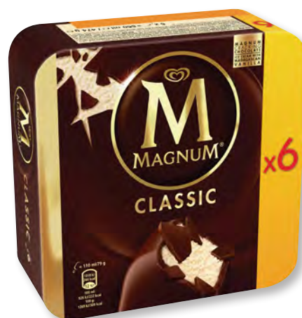
Classic 6x110 ml - Pack 4 10 02 18