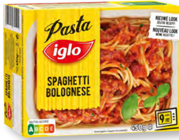
Spaghetti bolognese 450 g - Pack 6 24 15 37