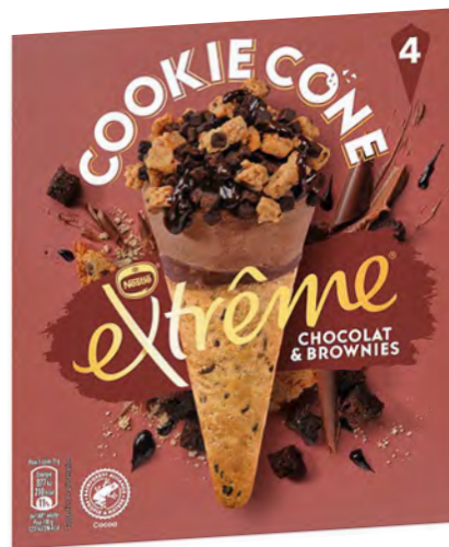
Cookie Cone Chocolat et brownie Chocolade en brownie 4x71 g - Pack 6 08 06 34