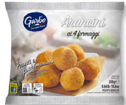
Arancini 4 fromages Arancini 4 kazen 300 g - Pack 13 23 12 21