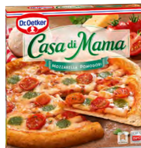
Mozzarella Pomodori 435 g - Pack 5 22 07 52