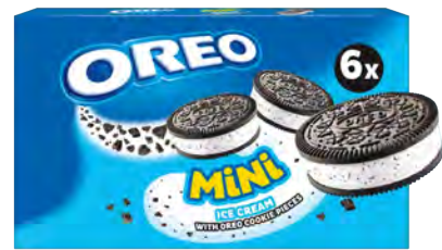
Sandwich mini Oreo Mini Oreo sandwich 6x55 ml - Pack 8 06 04 68