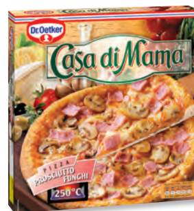
Prosciutto Funghi 425 g - Pack 5 22 07 36