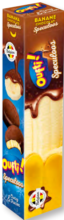
Pralines glacées Banane Spéculoos Ijspralines Banaan Speculaas 24x40 g - Pack 1 29 01 21