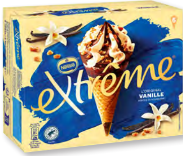
Extrême - Vanille 4x120 ml - Pack 4 08 06 16