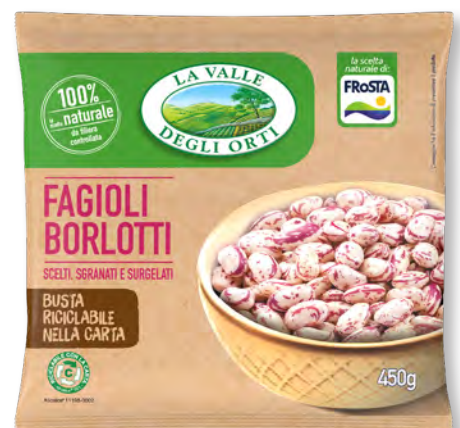
Haricots borlotti Borlottibonen 450 g - Pack 12 23 19 24