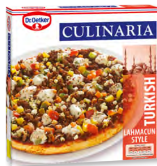
Turkish Style 400 g - Pack 5 22 07 75