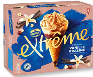
Extrême - Vanille Praliné 6x120 ml - Pack 6 03 20 75