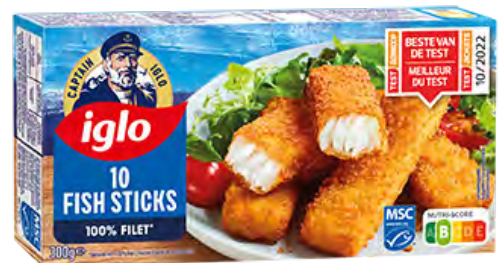
Fish sticks 10pc/st 300 g - Pack 12 24 07 13