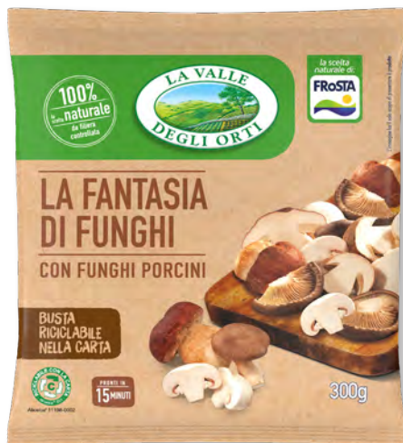
Fantaisie champignons Paddenstoelen mix 300 g - Pack 10 23 19 01