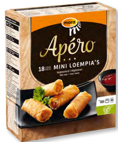
Mini Loempias 18 pc/st 360 g - Pack 12 22 20 23