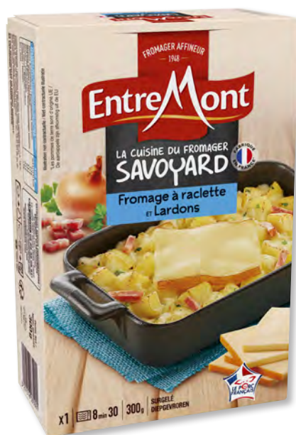
"Savoyard" Fromage à raclette avec Lardons Raclette kaas met spek 300 g - Pack 8 23 14 16