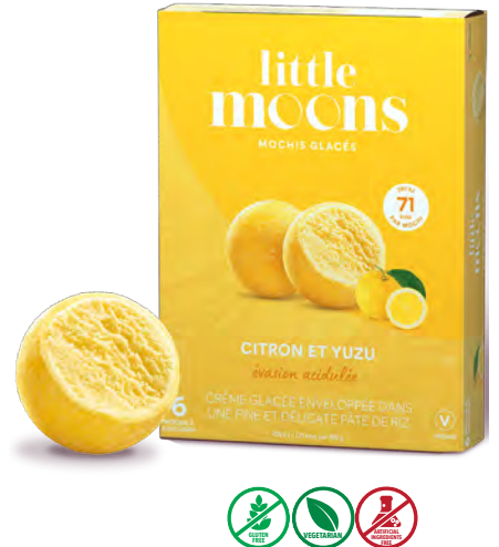
Mochi Citron Yuzu / Citroen Yuzu 6x32,5 g - Pack 10 02 80 07