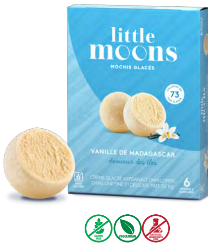
Mochi Vanille 6x32,5 g - Pack 10 02 80 01