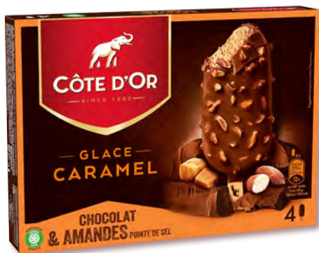
Stick Caramel - Chocolat & Amandes Stick Caramel - Chocolade & Amandelen 4X90 ml - Pack 8 18 00 09