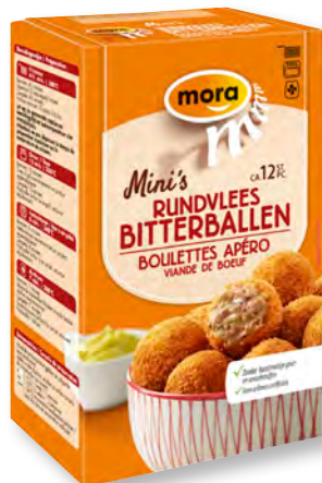
Boulettes Apéro 12 pc Bitterballen 12 st 440 g - Pack 5 22 20 32