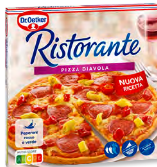
Diavola 350 g - Pack 7 22 08 77