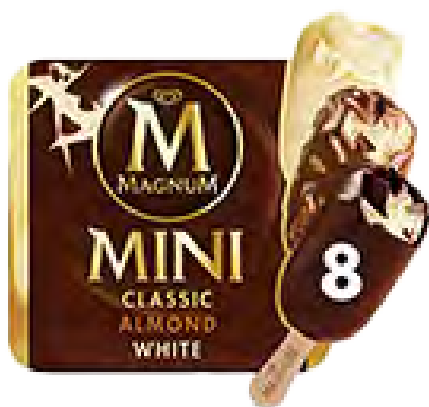
MINI Classic Almond White 8x55 ml - Pack 6 10 02 15