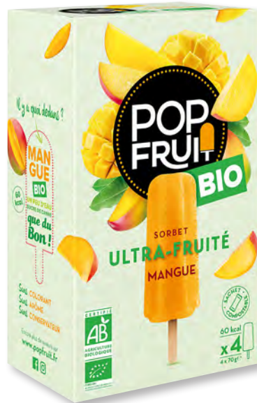
Mangue / Mango 4x70 g - Pack 12 07 20 13