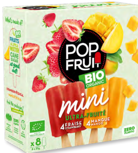
Fraise & Mangue Aardbei & Mango 8x35 g - Pack 12 07 20 20