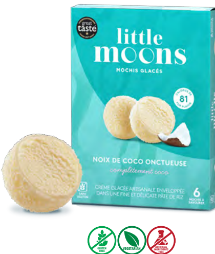
Mochi Coco / Kokosnoot 6x32,5 g - Pack 10 02 80 05