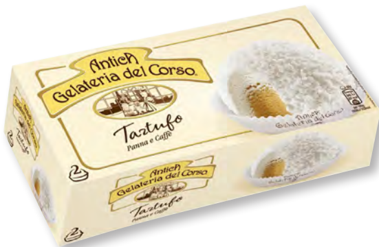
Tartufo Panna 2x80 g - Pack 6 03 12 56