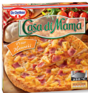
Hawaii 415 g - Pack 5 22 07 53