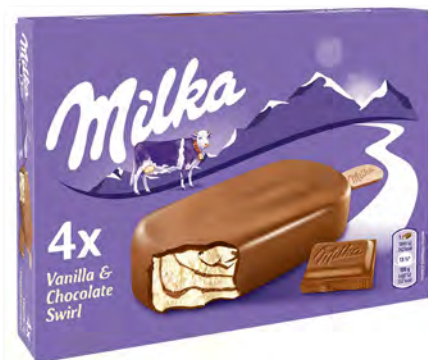
Sticks Vanille & Chocolat Sticks Vanille & Chocolade 4x90 ml - Pack 6 06 01 65