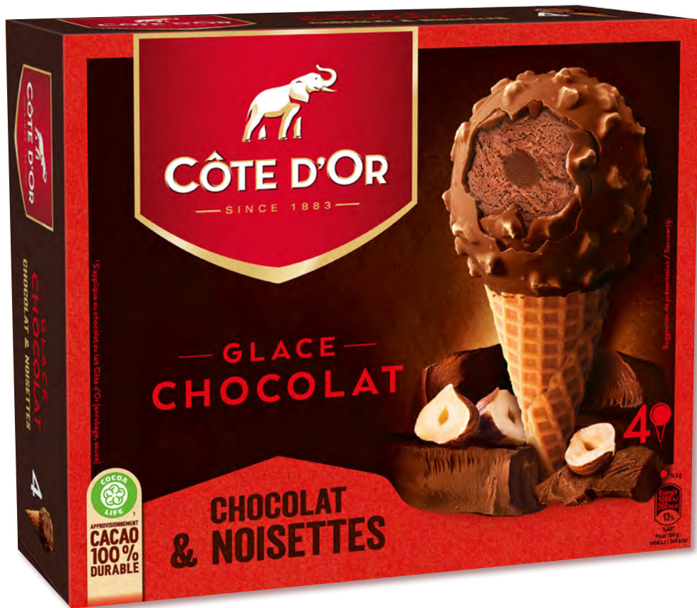
Cône Chocolat - Chocolat & Noisette Hoorntje Chocolade - Chocolade & Hazelnoot 4X110 ml - Pack 8 18 00 18