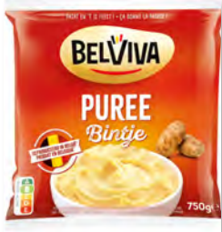
Purée bintje Aardappelpuree 750 g - Pack 12 23 01 12