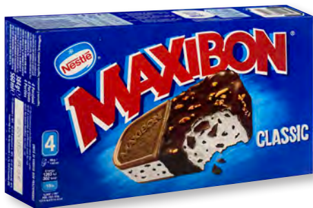
Maxibon Classic 4x110 ml - Pack 10 03 22 69