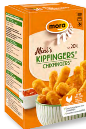
Chixfingers 20 pc Kipfingers 20 st 240 g - Pack 5 22 20 31