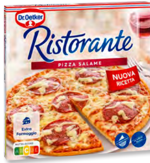
Salame 340 g - Pack 7 22 08 61