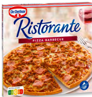
Barbecue 340 g - Pack 7 22 08 75