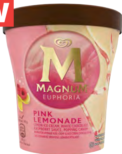
Euphoria - Pink lemonade 440 ml - Pack 8 10 02 00