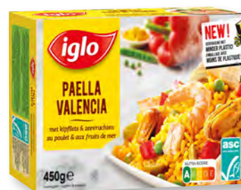
Paëlla Valencia Poulet Crevettes - Kip Garnalen 450 g - Pack 6 24 15 27