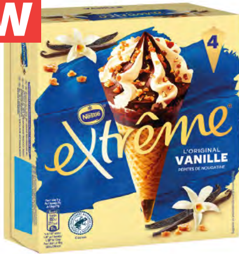
Extrême - Vanille 4x120 ml - Pack 6 08 06 16