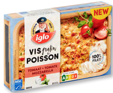
Gratin de poisson tomate mozzarella Visgratin tomaat mozzarella 380 g - Pack 10 24 15 67