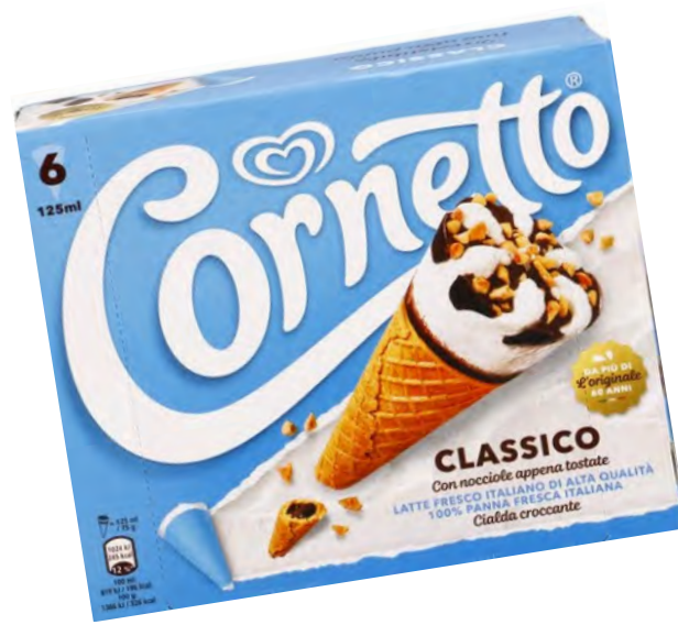
Classico 6x125 ml - Pack 6 10 01 96