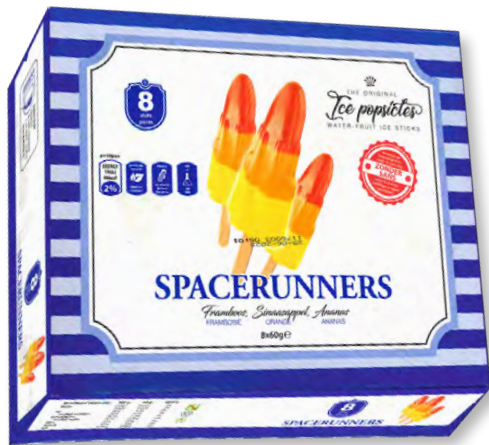
Spacerunners 8x60 ml - Pack 10 05 60 11