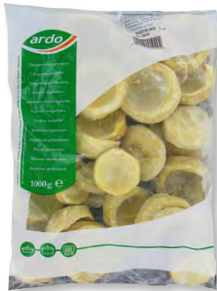
Fonds d'artichauts Artisjokbodems 1000 g - Pack 10 23 19 69