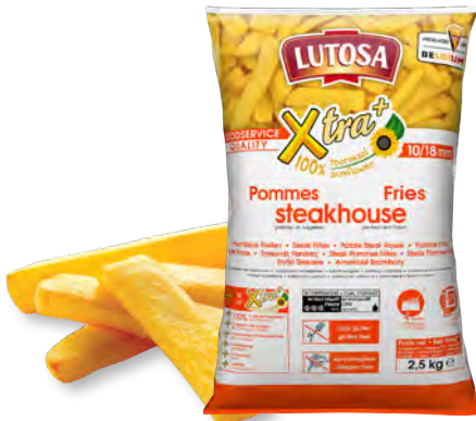
Frites steakhouse 10/18 extra Frieten steakhouse 10/18 extra 2500 g - Pack 4 23 00 91