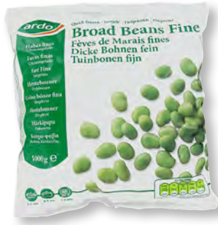
Fèves de marais Tuinbonen fijn 1000 g - Pack 10 23 19 60