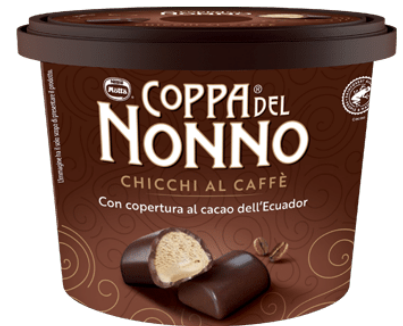
Coppa Del Nonno Chicchi Al Caffè 220 g - Pack 8 03 22 70