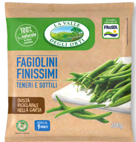
Haricots extra fins Extra fijne boontjes 600 g - Pack 12 23 19 33