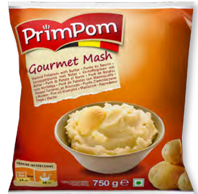
Purée gourmande Aardappelpuree 750 g - Pack 12 23 01 02