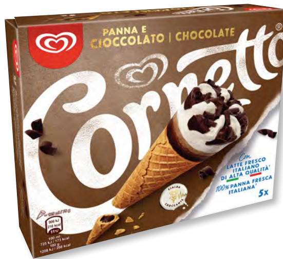
Chocolat / Chocolade 5x125 ml - Pack 6 10 02 13