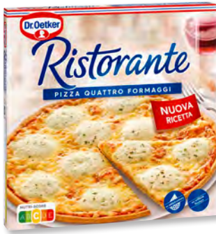
Quattro Formaggi 340 g - Pack 7 22 08 60