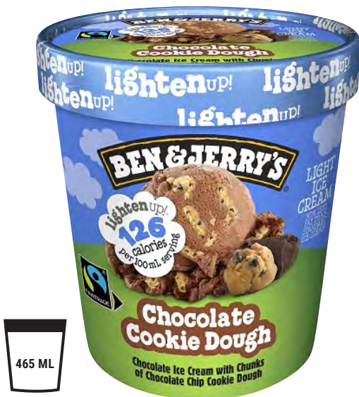
Pint lighten up - Chocolate cookie dough 465 ml - Pack 8 10 14 31