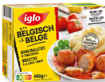
Boulettes sauce tomate Gehaktballetjes tomatensaus 450 g - Pack 6 24 15 03