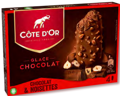
Stick Chocolat - Chocolat & Noisette Stick Chocolade - Chocolade & Hazelnoot 4X90 ml - Pack 8 18 00 08