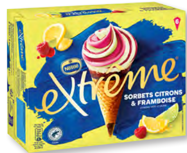
Extrême - Sorbet Citron & Framboise Extrême - Sorbet Citroen & Framboos 6x120 ml - Pack 6 03 20 57