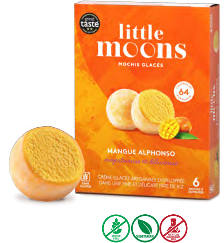
Mochi Mangue / Mango 6x32,5 g - Pack 10 02 80 04