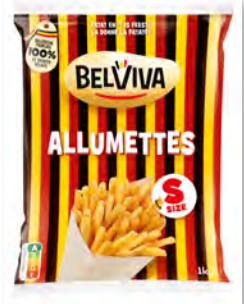
Frites allumettes Frieten allumettes 875 g - Pack 10 23 01 15