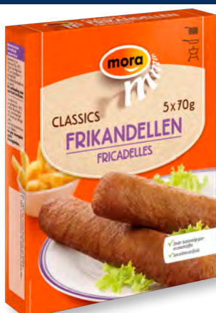
Fricadelles 5 pc Frikandellen 5 st 350 g - Pack 10 22 20 00