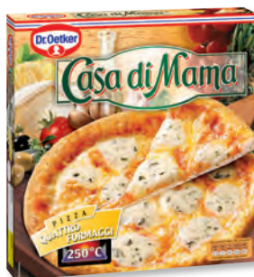
Quattro Formaggi 425 g - Pack 5 22 07 35