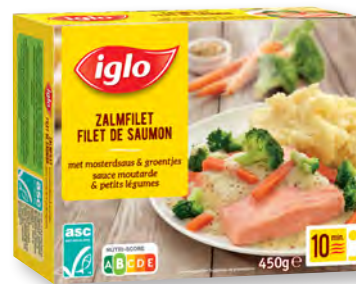
Filet de saumon moutarde légumes Zalmfilet mosterdsaus groentjes 450 g - Pack 6 24 15 36