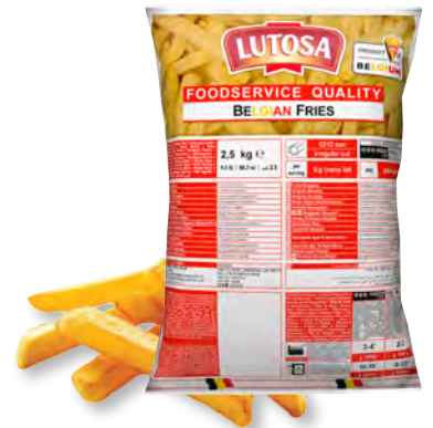
Frites belges Belgische frieten 2500 g - Pack 4 23 00 93