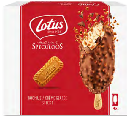
Sticks Speculoos 4x90 ml - Pack 12 07 70 00