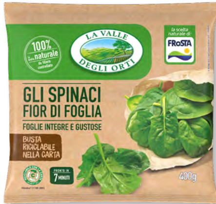
Epinards en portion Spinazie in porties 400 g - Pack 12 23 19 27