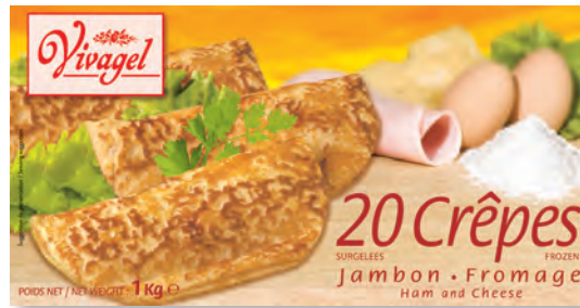
Crêpes Jambon fromage 20 pc Flapjes Ham & Kaas 20 st 1000 g - Pack 4 22 04 99