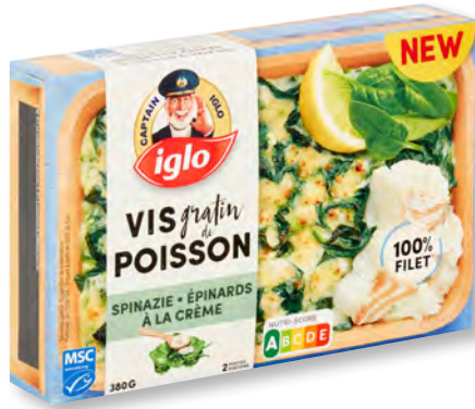
Gratin de poisson épinards à la crème Visgratin spinazie met room 380 g - Pack 10 24 15 66