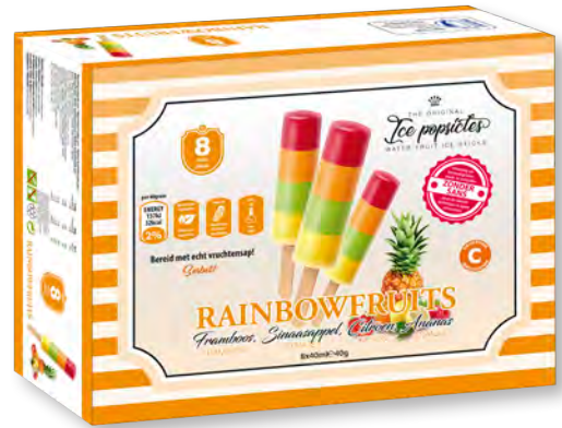
Rainbow Fruits 8x40 ml - Pack 10 05 60 17