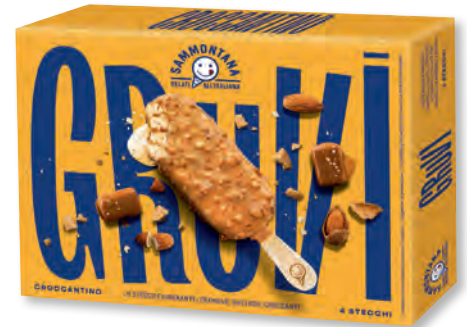
Gruvi Croccantino 4x75 ml - Pack 8 27 03 01