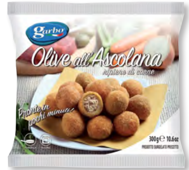
Olive all'Ascolana Olives & viande Olijf & vlees 300 g - Pack 13 23 12 03