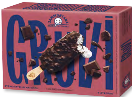
Gruvi Stracciatella 4x75 ml - Pack 8 27 03 02