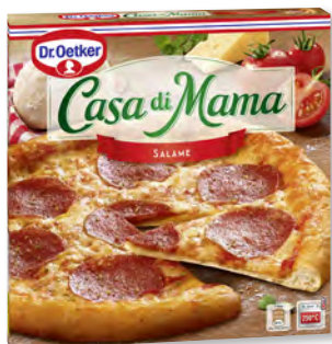
Salame 390 g - Pack 5 22 07 34