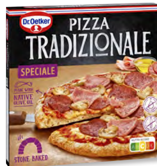
Speciale 400 g - Pack 5 22 08 41