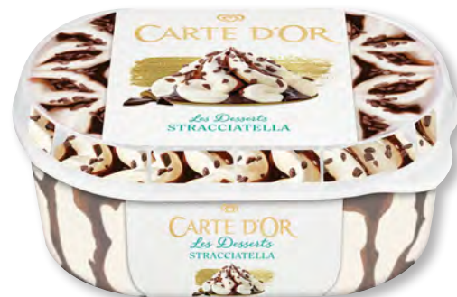
Stracciatella 700 ml - Pack 6 10 01 95