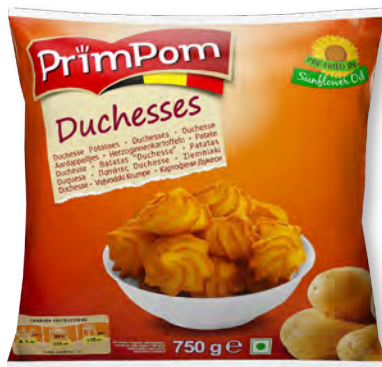
Duchesses 750 g - Pack 12 23 01 03