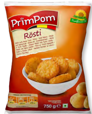
Rösti nature Natuur rösti 750 g - Pack 12 23 01 04