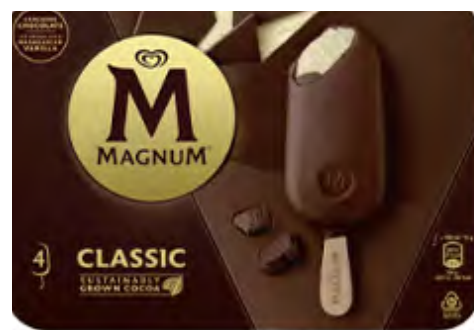
Magnum Classic 4x110 ml - Pack 6 10 02 17