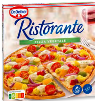
Vegetale 385 g - Pack 7 22 08 69