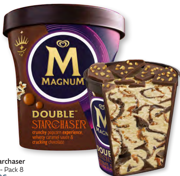
Pint Starchaser 440 ml - Pack 8 10 02 96