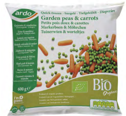
Petits pois doux & carottes - BIO Zoete erwten & wortelen - BIO 600 g - Pack 15 23 19 84