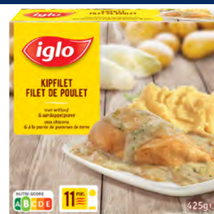
Filet de poulet aux chicons Kipfilet met witloof 425 g - Pack 6 24 15 13