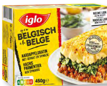
Hachis Parmentier aux épinards Aardappelgratin gehakt met spinazie 450 g - Pack 6 24 15 18