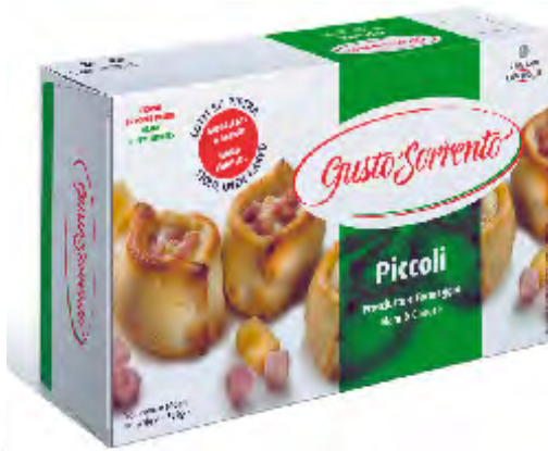
Piccoli ham & cheese 10x30 g - Pack 12 22 10 51