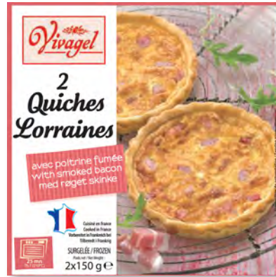
2 Quiches Lorraines 2x150 g - Pack 6 23 08 17