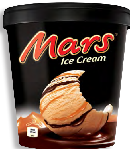
Pint Ice Cream MARS 450 ml - Pack 8 09 09 32