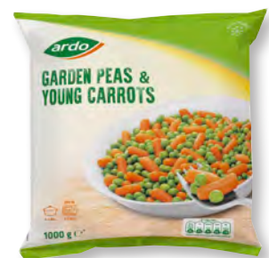
Petits pois doux très fins & Jeunes carottes Tuinerwten zeer fijn & Jonge wortelen 1000 g - Pack 10 23 19 67