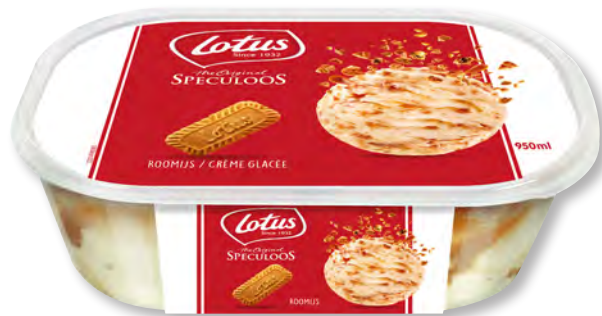
Bac / Bak 950 ml - Pack 6 07 70 02