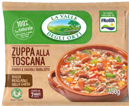
Zuppa Toscana 450 g - Pack 12 23 19 19