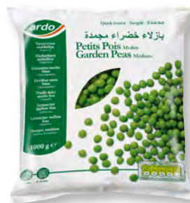
Petits pois doux mi-fins Tuinerwten middelfijn 1000 g - Pack 10 23 19 64