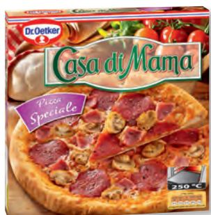
Speciale 432 g - Pack 5 22 07 38