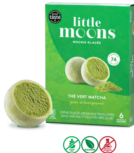
Mochi Thé vert / Groene thee 6x32,5 g - Pack 10 02 80 06