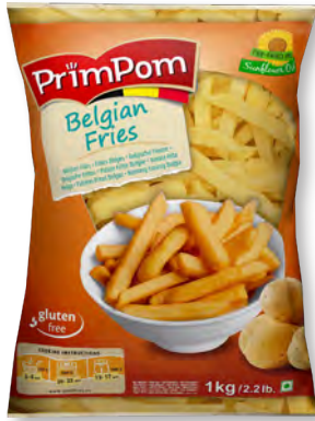
Frites belges Belgische frieten 1000 g - Pack 10 23 00 97