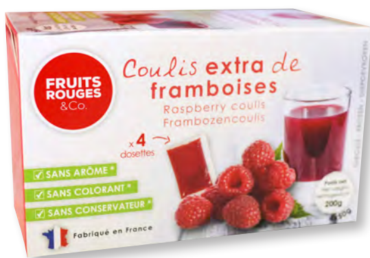
Coulis de framboise - Frambozen coulis 4x50 g - Pack 12 20 12 40