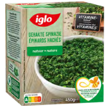
Epinards hachés en portion Portie gehakte spinazie 450 g - Pack 8 24 00 14