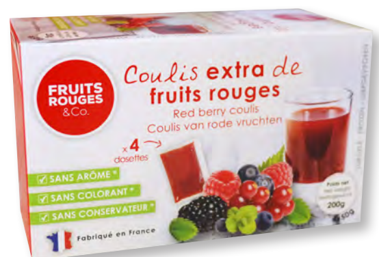
Coulis de fruits rouges - Rode vruchten coulis 4x50 g - Pack 12 20 12 41