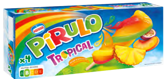
Pirulo Tropical 4x80 ml - Pack 6 08 05 25