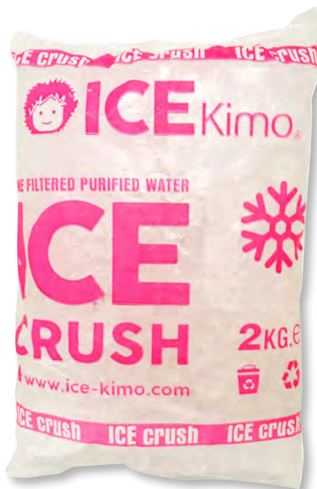
Glace pilée / Crushed ijsblokjes 2000 g - Pack 6 29 00 49