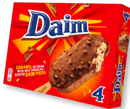
Sticks Caramel avec morceaux de Daim Sticks Karamel met stukjes Daim 4x110 ml - Pack 8 06 01 62