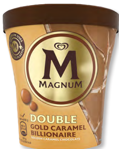
Pint Double Gold Caramel Billionaire 440 ml - Pack 8 10 02 94