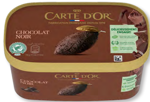
Chocolat noir / Pure chocolade 700 ml - Pack 6 10 01 94