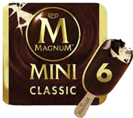
MINI Classic 6x55 ml - Pack 6 10 02 16