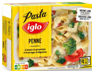
Penne 4 fromages aux légumes Penne 4 kazen met groenten 450 g - Pack 6 24 15 29