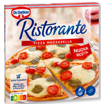
Mozzarella 355 g - Pack 7 22 08 68