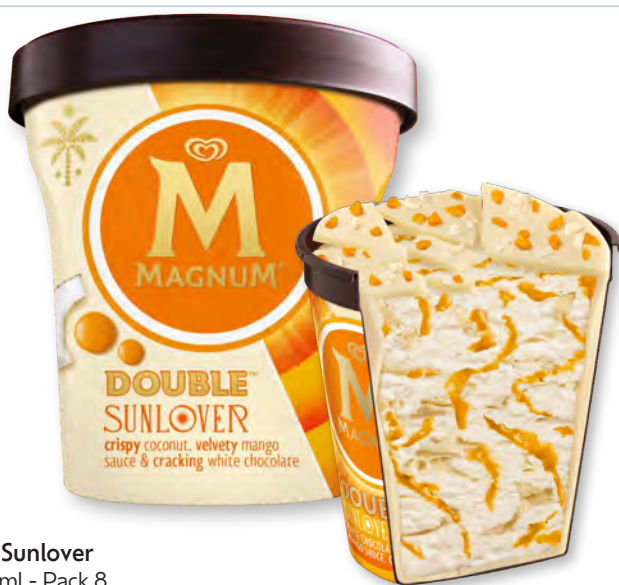
Pint Sunlover 440 ml - Pack 8 10 02 97