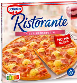
Prosciutto 340 g - Pack 7 22 08 63