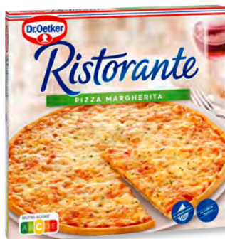
Margherita 295 g - Pack 7 22 08 76