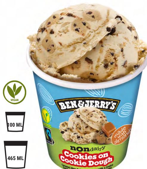
Cup non dairy - Cookie dough 12x100 ml - Pack 1 10 11 02