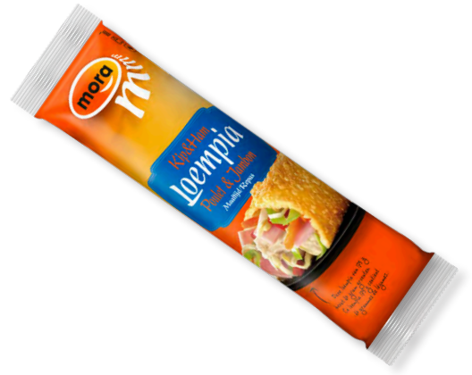
Loempia Jambon Poulet - Ham Kip 175 g - Pack 12 22 20 28