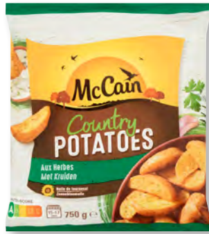
Country potatoes aux herbes Country potatoes met kruiden 750 g - Pack 12 23 00 89