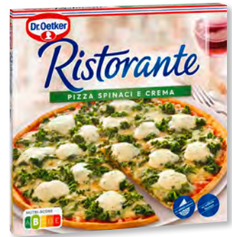
Spinaci e Crema 390 g - Pack 7 22 08 65