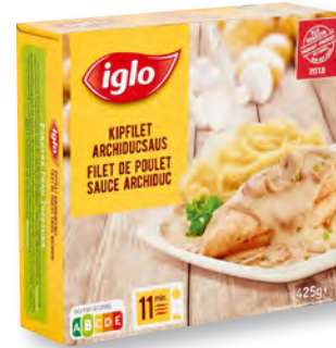
Filet de poulet sauce archiduc Kipfilet archiducsaus 425 g - Pack 6 24 15 54