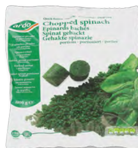
Epinards en portions Spinazie in porties 1000 g - Pack 10 23 19 66