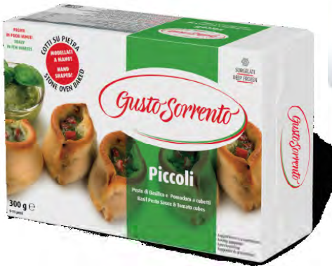
Piccoli basil pesto & cherry tomato 10x30 g - Pack 12 22 10 52