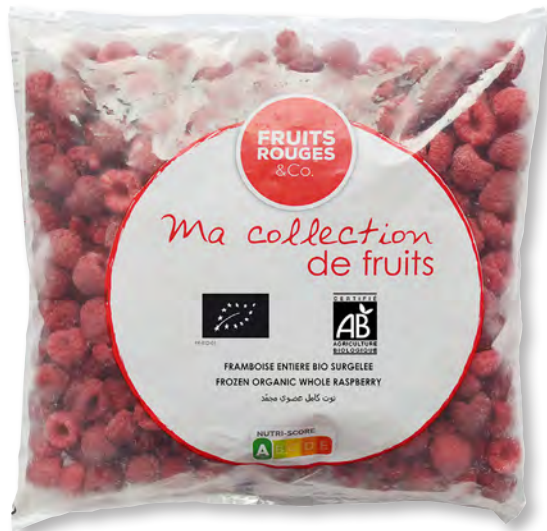
Framboises entières BIO Volledige frambozen 450 g - Pack 10 20 12 71