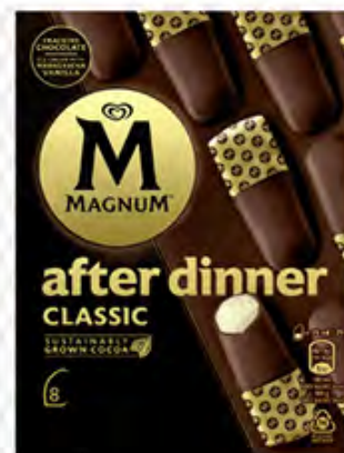
After Dinner Classic 8x35 ml - Pack 8 10 02 14