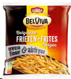
Frites belges au four Belgische frieten 750 g - Pack 12 23 00 69