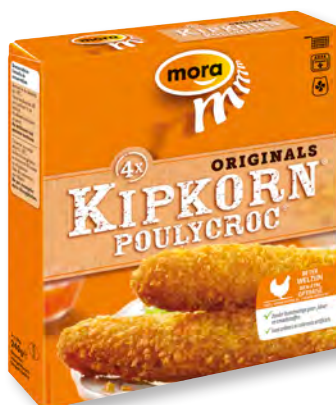
Originals Kipkorn Poulycroc 4 pc/st 240 g - Pack 10 22 20 41