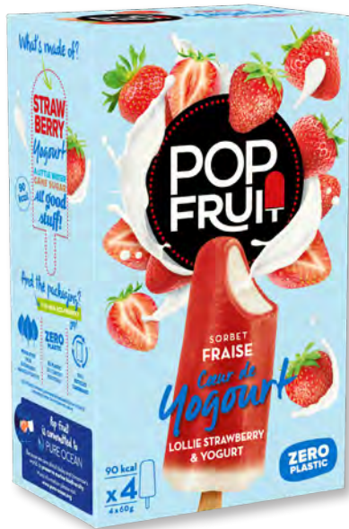
Coeur de Yogourt Fraise / Aardbei 4x60 g - Pack 12 07 20 14