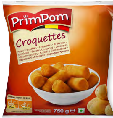
Croquettes Kroketten 750 g - Pack 12 23 01 00