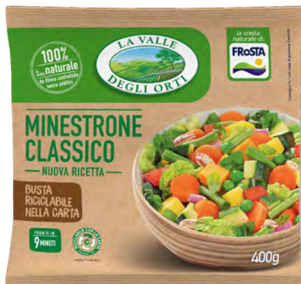
Minestrone traditionnel Traditionele minestrone 400 g - Pack 12 23 19 31