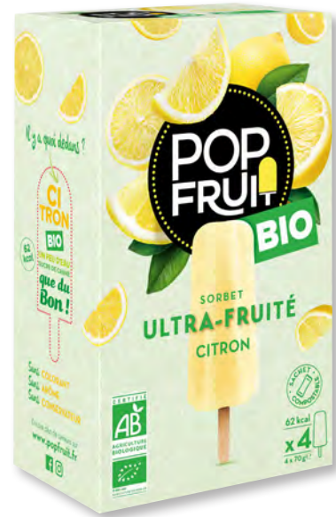
Citron / Citroen 4x70 g - Pack 12 07 20 11