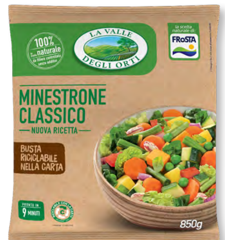
Minestrone traditionnel Traditionele minestrone 850 g - Pack 8 23 19 32