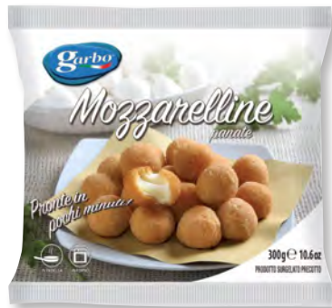
Mozzarelline Boules panées Gepaneerde balletjes 300 g - Pack 13 23 12 04