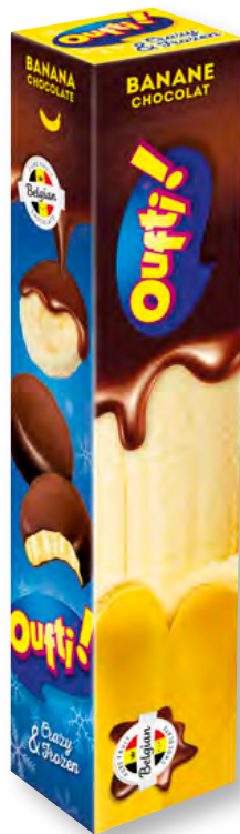
Pralines glacées Banane Ijspralines Banaan 24x40 g - Pack 1 29 01 22