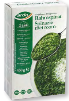
Epinards à la crème en portions Spinazie met room in porties 450 g - Pack 6 23 19 76