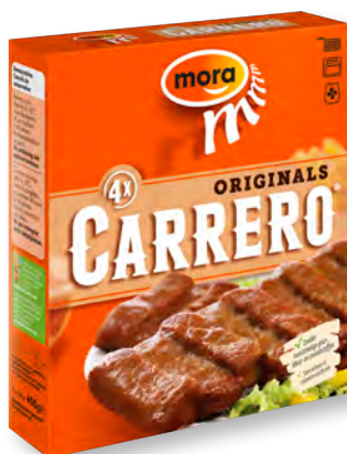
Carrero Originals 4 pc/st 280 g - Pack 10 22 20 10