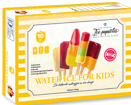
Water Ice for Kids 10x54 ml - Pack 10 05 60 22