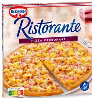
Carbonara 340 g - Pack 7 22 08 73