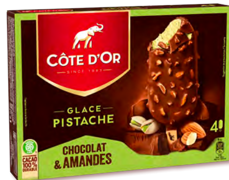
Stick Pistache - Chocolat & Amandes Stick Pistache - Chocolade & Amandelen 4X90 ml - Pack 8 18 00 10