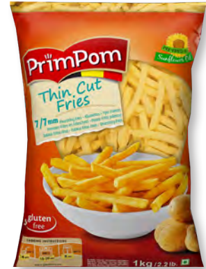
Frites allumettes 7-7 Allumettes frieten 7-7 1000 g - Pack 10 23 00 99