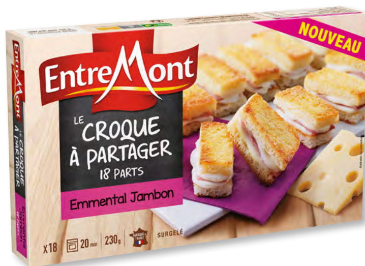
"Croque à partager" 18 pc/st Emmental Jambon - Ham Emmental 230 g - Pack 8 23 14 06