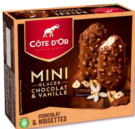
Mini Sticks - Chocolat & Vanille Mini Sticks - Chocolade & Vanille 8x25 ml - Pack 9 18 00 03