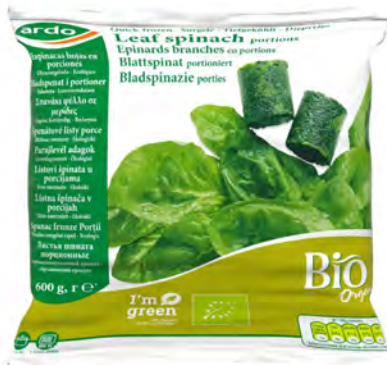
Epinards branches en portions - BIO Bladspinazie in porties - BIO 600 g - Pack 15 23 19 85