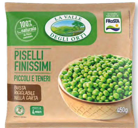
Petits pois extra fins Extra fijne erwtes 450 g - Pack 12 23 19 03