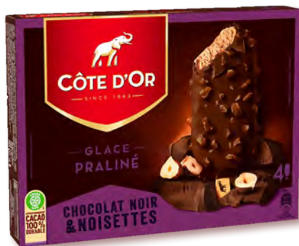
Stick Praliné - Chocolat noir & Noisette Stick Praline - Pure chocolade & Hazelnoot 4X90 ml - Pack 8 18 00 06