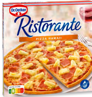
Hawaii 355 g - Pack 7 22 08 67