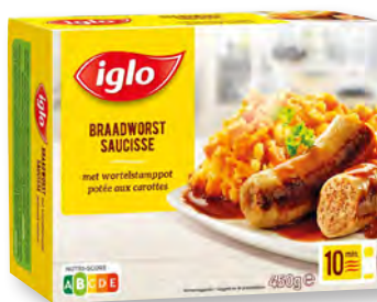
Saucisse Potée aux carottes Braadworst met wortelstampot 450 g - Pack 6 24 15 35