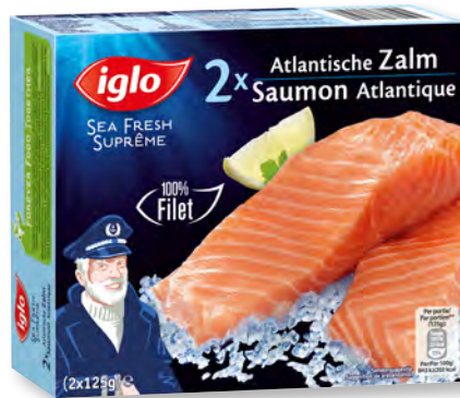
Saumon atlantique 2 pc Atlantische zalm 2 st 250 g - Pack 6 24 06 03