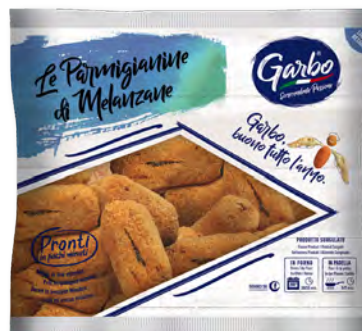
Morceaux d'aubergines panés farcis tomate mozzarella Gepaneerde en gebakken stukjes aubergine gevuld tomaat mozzarella 300 g - Pack 15 23 12 24