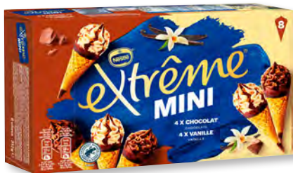
Extrême Mini - Cônes Vanille & Chocolat Extrême Mini - Hoorntjes Vanille & Chocolade 8x39 g - Pack 7 08 06 20