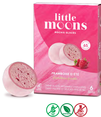
Mochi Framboise / Framboos 6x32,5 g - Pack 10 02 80 02