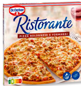
Bolognese e Formaggi 375 g - Pack 7 22 08 74