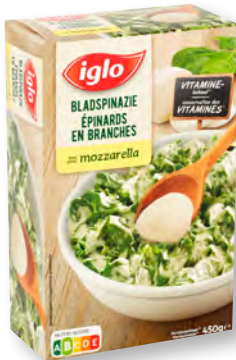
Epinards en branche mozzarella Bladspinazie mozzarella 450 g - Pack 5 24 15 62