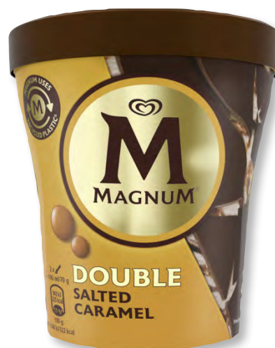
Pint Double Salted Caramel 440 ml - Pack 8 10 02 93