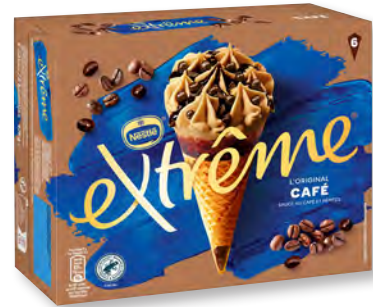
Extrême - Café Extrême - Koffie 6x120 ml - Pack 6 03 20 62