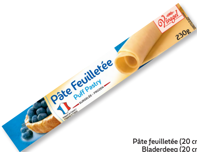
Pâte feuilletée (20 cm) Bladerdeeg (20 cm) 230 g - Pack 24 23 07 83