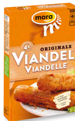
Viandelles 4 pc Viandel 5 st 280 g - Pack 12 22 20 09