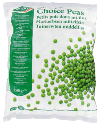
Petits poids doux mi-fins Tuinerwten middelfijn 2500 g - Pack 4 23 19 72