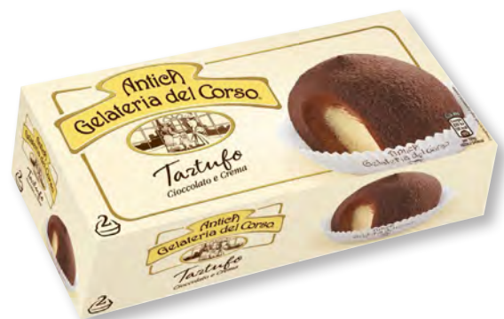
Tartufo Cacao 2x80 g - Pack 6 03 12 55