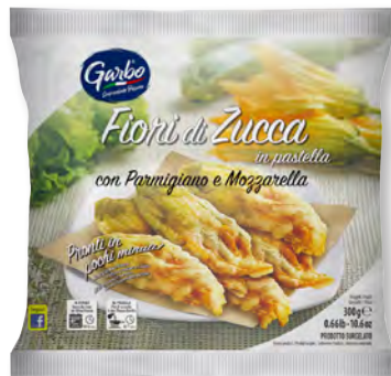
Fleurs de courgette Parmesan Mozzarella Courgette bloempjes Parmezaan mozzarella 300 g - Pack 13 23 12 22