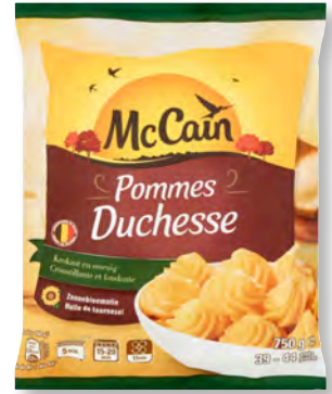
Pommes Duchesse 750 g - Pack 12 23 01 18