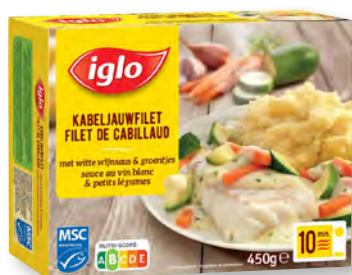
Filet de cabillaud au vin blanc Kabeljaufilet met witte wijn 450 g - Pack 6 24 15 16