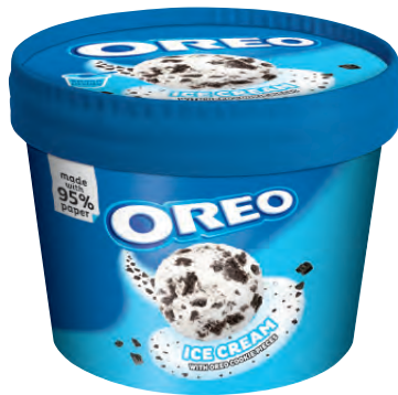
Ice cream Cup cookie & Oreo pieces 145 ml - Pack 20 06 00 97