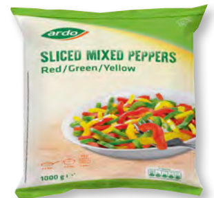
Poivrons rouges/verts/jaunes en lanières Paprika rood/groen/geel reepjes 1000 g - Pack 10 23 19 65