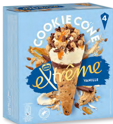
Extrême Cookie Cone - Vanille 4x71 g - Pack 6 08 06 30