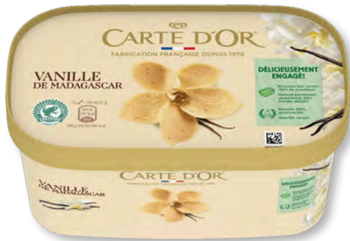
Vanille Madagascar 700 ml - Pack 6 10 01 99