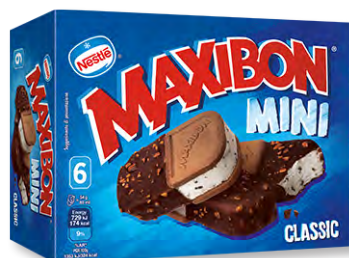
Maxibon Mini Classic 6x85 ml - Pack 8 03 22 71