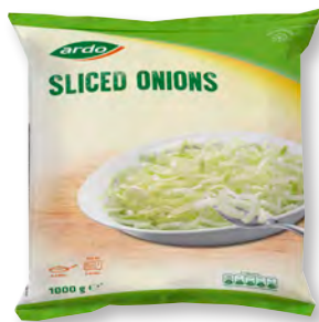
Oignons coupés Gesneden ajuin 1000 g - Pack 10 23 19 63