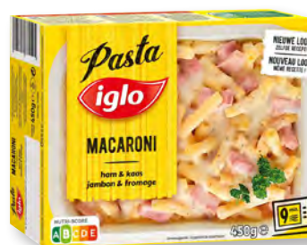
Macaroni Jambon Fromage Macaroni Ham Kaas 450 g - Pack 6 24 15 22