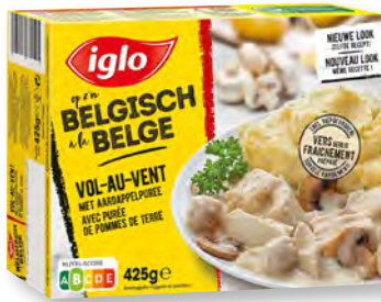
Vol-au-vent avec purée Vol-au-vent met aardappelpuree 425 g - Pack 6 24 15 52