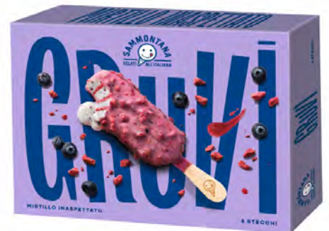
Gruvi Myrtilles / Bosbessen 4x75 ml - Pack 8 27 03 04