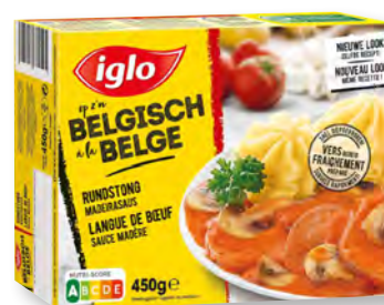
Langue de boeuf sauce Madère Ossentong Madeirasaus 450 g - Pack 6 24 15 19