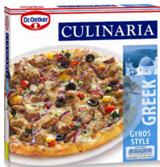
Greek Style 350 g - Pack 5 22 07 71