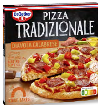
Diavola Calabrese 360 g - Pack 5 22 08 43