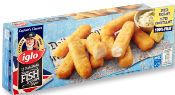
Crisp fish sticks 12 pc/st 336 g - Pack 12 24 15 61