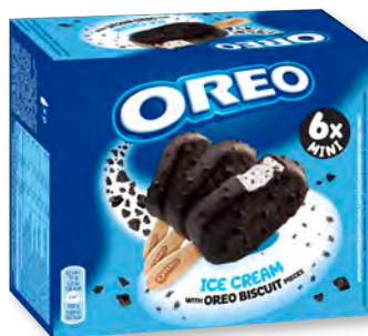
Mini Sticks avec morceaux de biscuit Oreo Mini Sticks met stukjes Oreo Koekje 6x50 ml - Pack 10 06 01 57