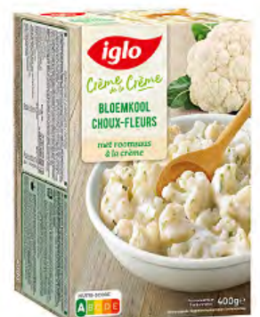
Choux-fleurs à la crème Bloemkool met room 400 g - Pack 5 24 01 26