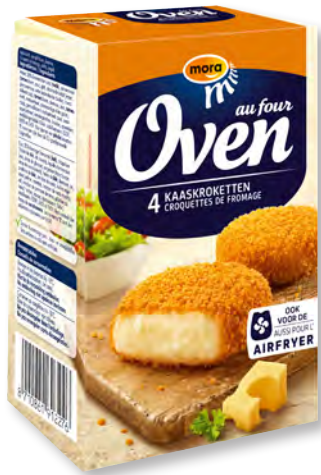
Croquettes au fromage au Four 4 pc Oven Kaaskroketten 4 st 280 g - Pack 6 22 20 38