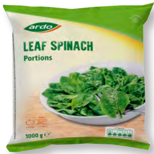
Epinards branches en portions Bladspinazie in porties 1000 g - Pack 10 23 19 68