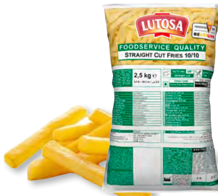
Frites 10/10 Frieten 10/10 2500 g - Pack 4 23 00 92