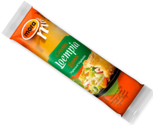
Loempia Légumes - Groenten 175 g - Pack 12 22 20 27