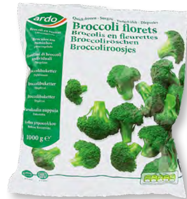
Broccoli 40-60mm Broccoli 40-60mm 1000 g - Pack 10 23 19 70