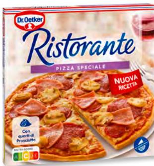
Speciale 340 g - Pack 7 22 08 66