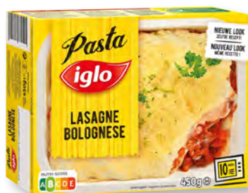
Lasagne Bolognese 450 g - Pack 6 24 15 21