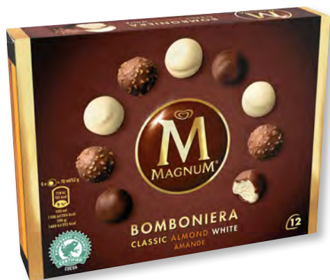
Bomboniera Classic Almond White 6x55 ml - Pack 6 10 00 28