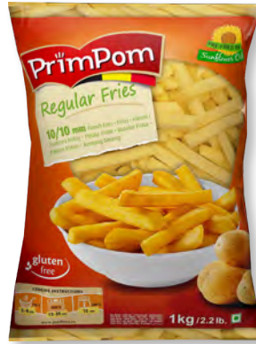
Frites 10-10 Frieten 10-10 1000 g - Pack 10 23 00 98