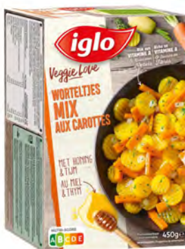
Carottes au miel et thym Wortelen met honing en thym 450 g - Pack 5 24 01 03