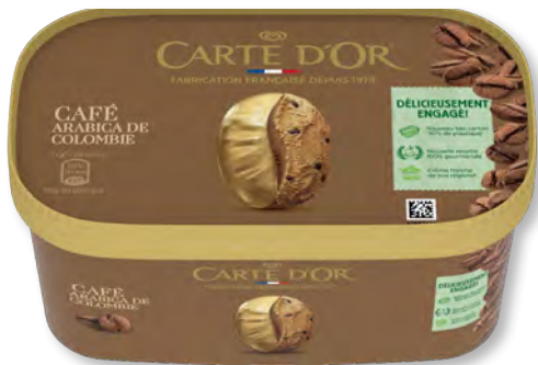
Café Arabica Koffie 700 ml - Pack 6 10 01 93