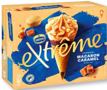
Extrême - Macaron Caramel 6x110 ml - Pack 6 03 20 55