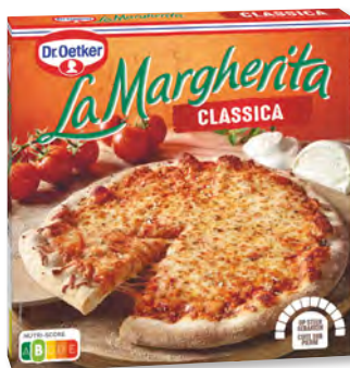
Classica 265 g - Pack 7 22 07 80