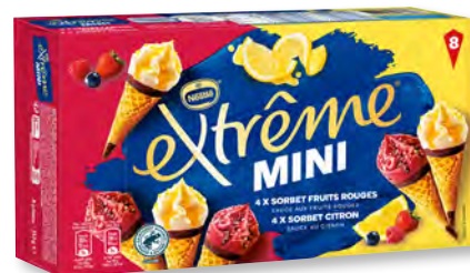
Extrême Mini - Cônes Citron & Fruits rouges Extrême Mini - Hoorntjes Citroen & Rode vruchten 8x39 g - Pack 7 08 06 21