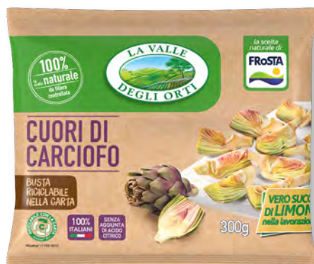
Coeurs d'artichaut Artisjok harten 300 g - Pack 12 23 19 10