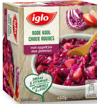
Choux rouges aux pommes Rode kool met appeltjes 450 g - Pack 8 24 01 05