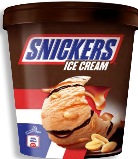
Pint Ice Cream SNICKERS 450 ml - Pack 8 09 09 35