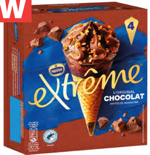
Extrême - Chocolat Extrême - Chocolade 4x120 ml - Pack 6 08 06 17