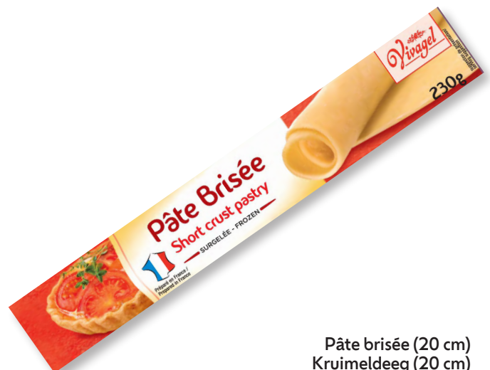
Pâte brisée (20 cm) Kruimeldeeg (20 cm) 230 g - Pack 24 23 07 84