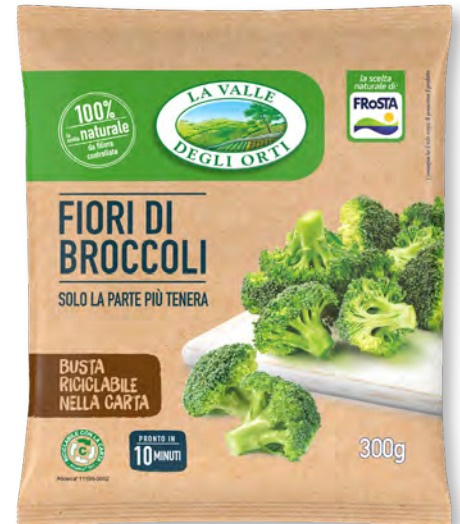
Fleurs de broccoli Broccolirosjes 300 g - Pack 12 23 19 25