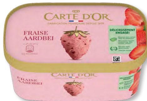
Fraise avec morceaux Aardbei met stukjes 900 ml - Pack 6 10 02 39