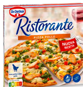
Pollo 355 g - Pack 7 22 08 70