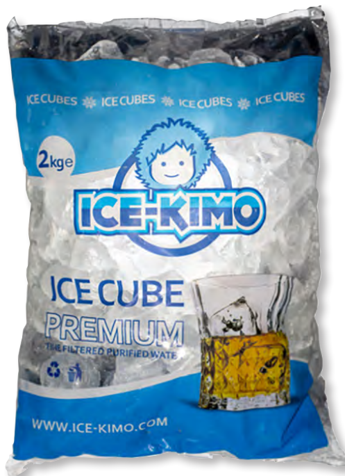
Glaçons Ijsblokjes 2000 g - Pack 6 29 00 50