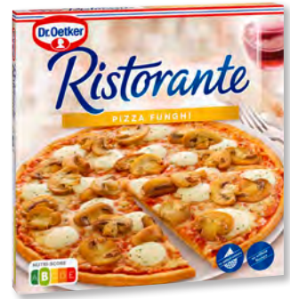
Funghi 365 g - Pack 7 22 08 62