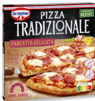
Pancetta Delicata 390 g - Pack 5 22 08 40