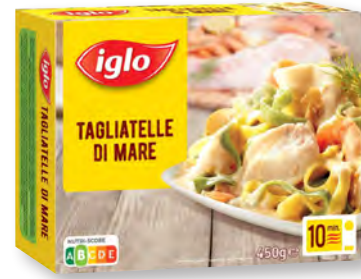
Tagliatelle di mare 450 g - Pack 6 24 15 40