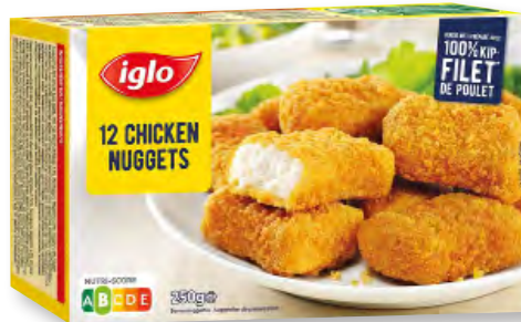
12 Chicken Nuggets 250 g - Pack 10 24 14 02