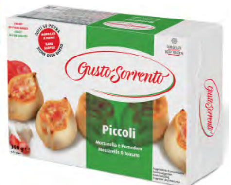
Piccoli mozzarella & tomato 10x30 g - Pack 12 22 10 50