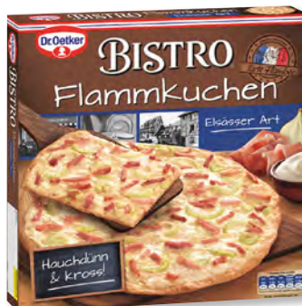
Ham & crème fraîche 265g - Pack 7 22 08 02