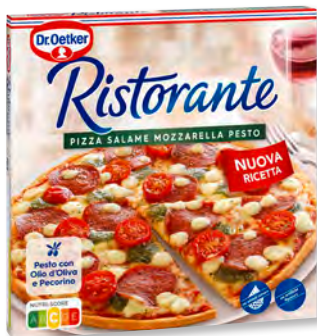
Salame Mozza Pesto 360 g - Pack 7 22 08 72