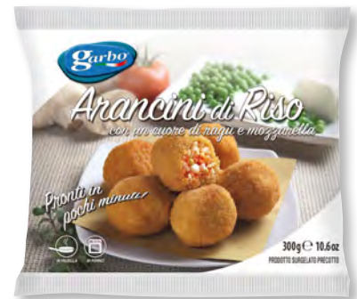
Arancini de riso Bolognese Mozzarella 300 g - Pack 13 23 12 02