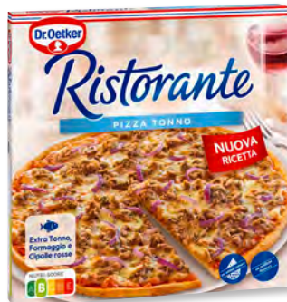
Tonno 355 g - Pack 7 22 08 64