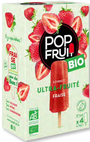
Fraise / Aardbei 4x70 g - Pack 12 07 20 12